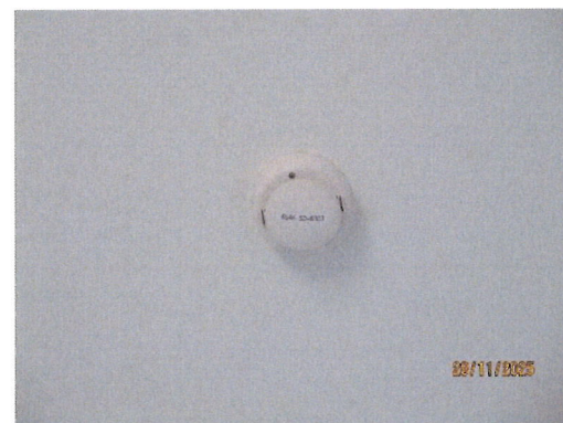
ภาพที่ 2-7 อุปกรณ์แจ้งเตือนและป้องกันอัคคีภัยบริเวณสถานีควบคุมก๊าซ