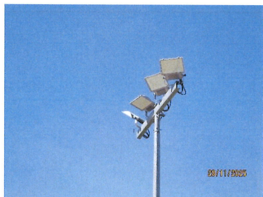
ภาพที่ 2-6 เครื่องมืออุปกรณ์ชนิดป้องกันการระเบิด