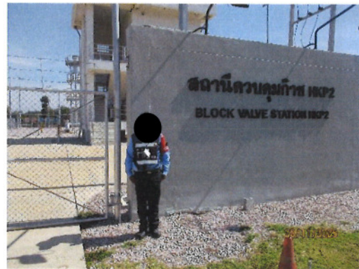
ภาพที่ 2-8 เจ้าหน้าที่รักษาความปลอดภัย