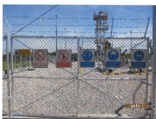
ภาพที่ 2-2 ป้ายเตือนสวมใส่อุปกรณ์ป้องกันอันตรายส่วนบุคคล (PPE)