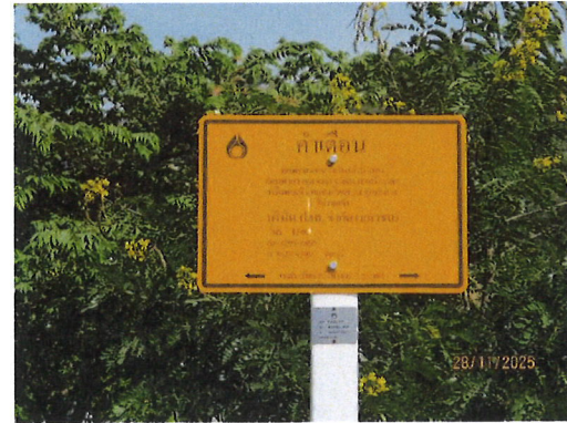
ภาพที่ 2-4 ป้ายเตือน (Pipeline Markers)