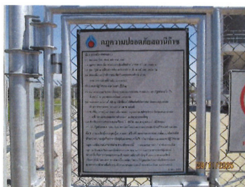
ภาพที่ 2-1 ป้ายกฎระเบียบความปลอดภัยในการปฏิบัติงาน