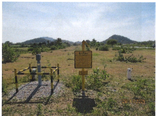
ภาพที่ 2-5 ป้ายและสัญลักษณ์แสดงตำแหน่งแนววางท่อส่งก๊าซ