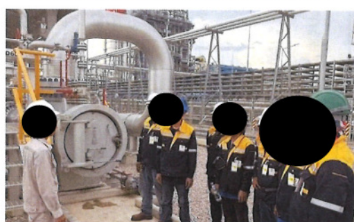
ภาพที่ 2-3 พนักงานสวมใส่อุปกรณ์ PPE